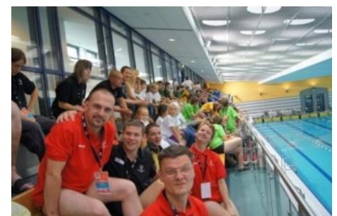
Gute Stimmung auf den Rängen